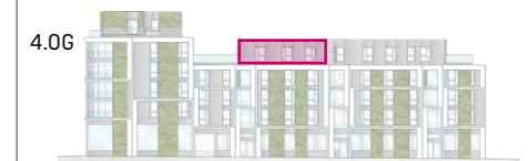
Haus B Ansicht Ost