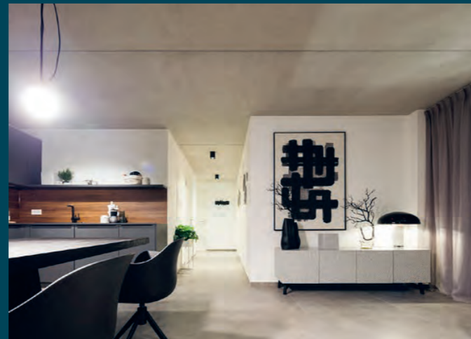
Urban (oben links) Loft (oben rechts) Natur (unten)