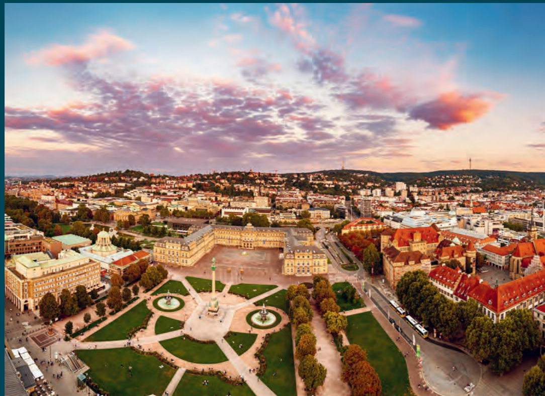
Direkte Anbindung an die Landeshauptstadt

Ditzingen verbindet wirtschaftliche Stärke, hervorragende Anbindung und naturnahe Erholung. Mit vielseitigen Bildungs- und Freizeitangeboten bietet die Stadt ideale Voraussetzungen für Familien, Berufstätige und Investoren.