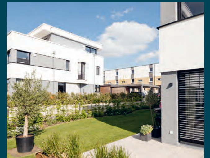
Arkadien Ulm/Dornstadt, 2022