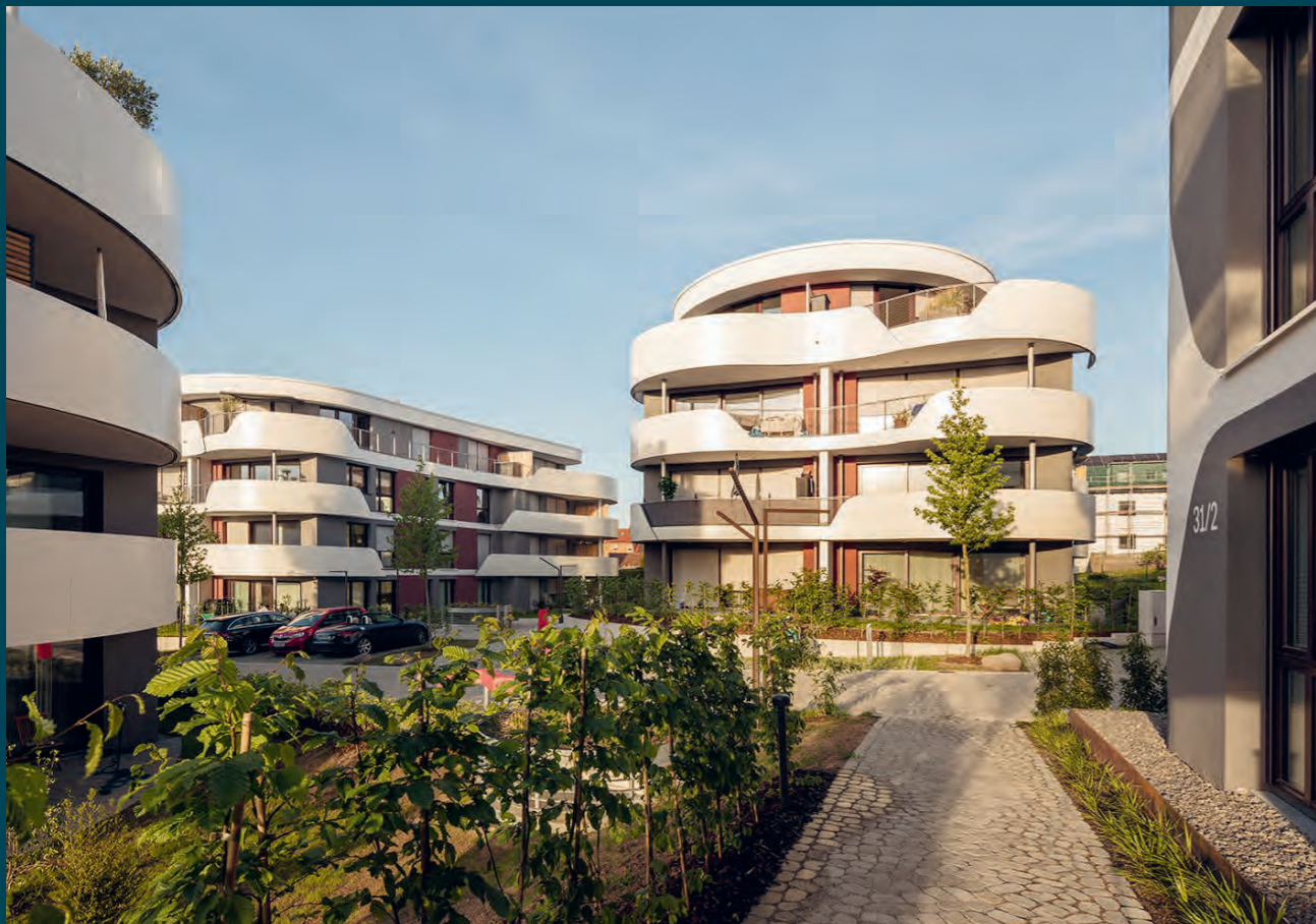
Sachsenheim Green Hills, 2023