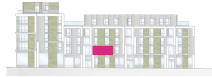
Haus B - Ansicht Ost