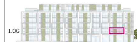
Haus A Ansicht Süd