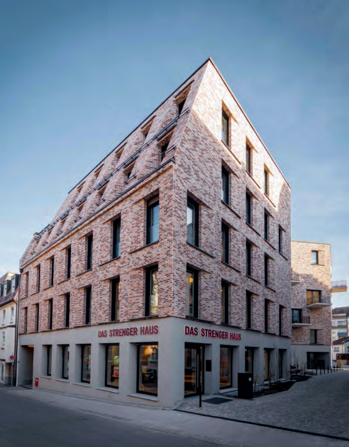
Ludwigsburg Das Strenger Haus, 2021