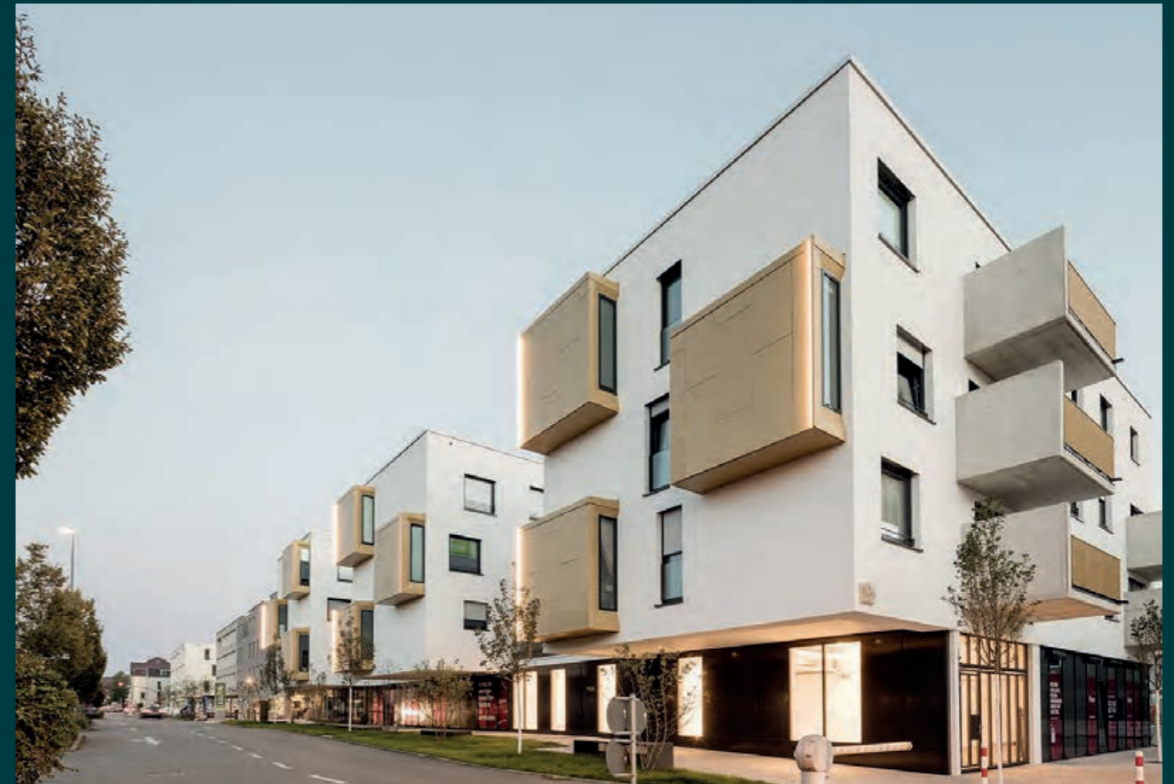
Kirchheim/Teck City Cube, 2018