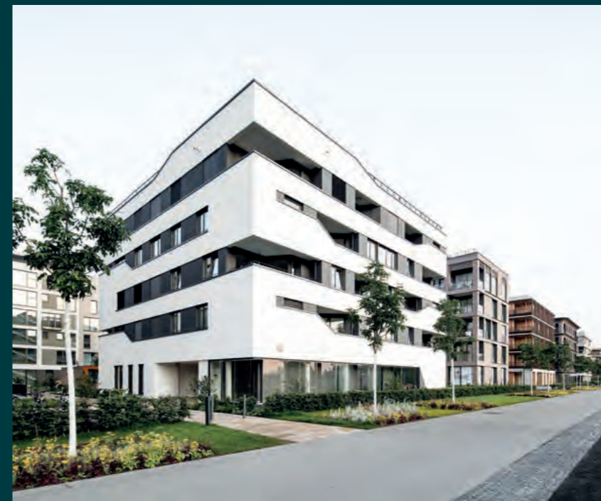
Heilbronn Urban Garden, 2018