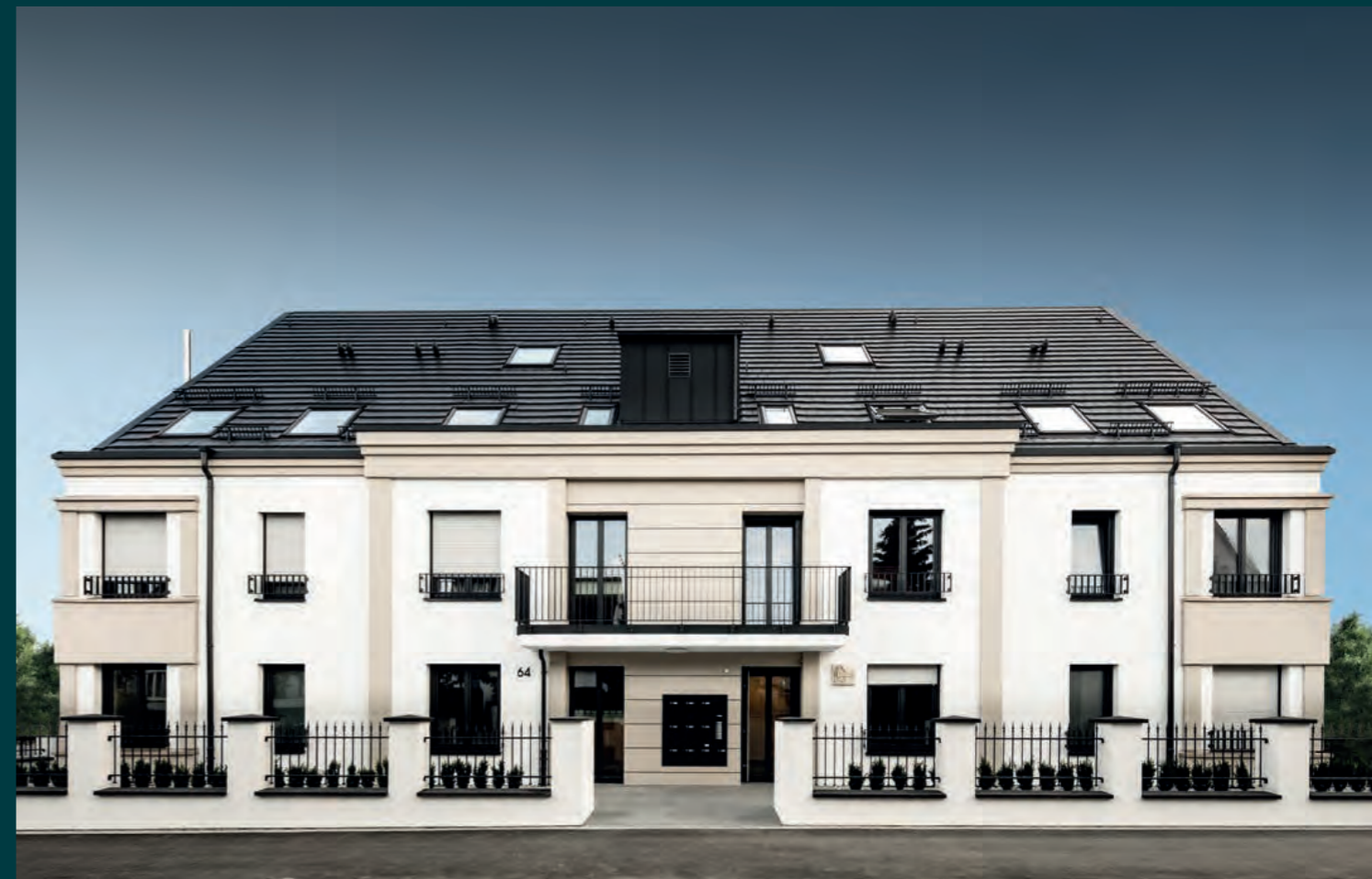
Ludwigsburg Barockoko, 2017