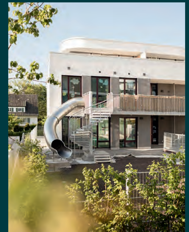
Sachsenheim Green Hills, 2023