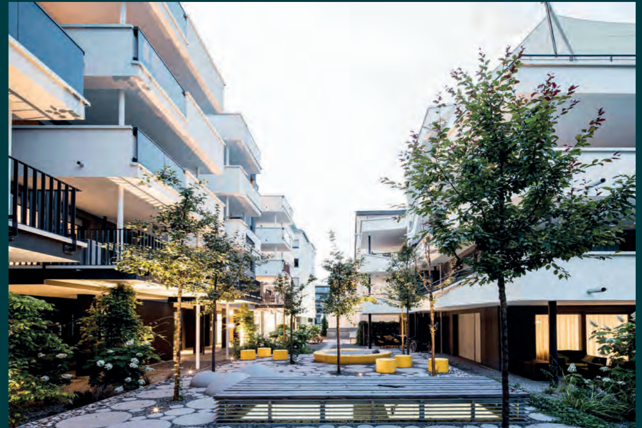
Stuttgart City-Puls, 2016