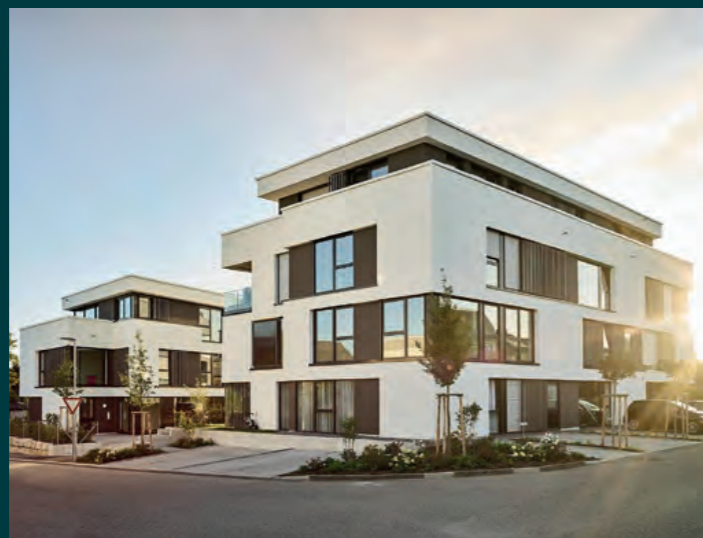
Löchgau Living Together, 2021