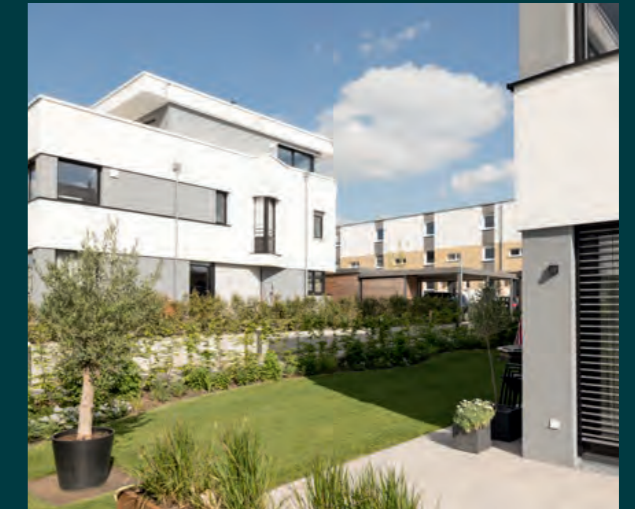
Akardien Ulm/Dornstadt, 2022