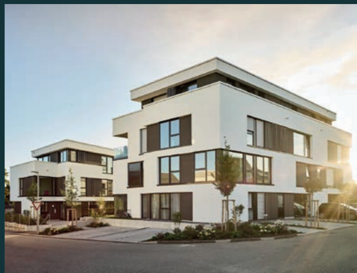
Löchgau Living Together, 2021