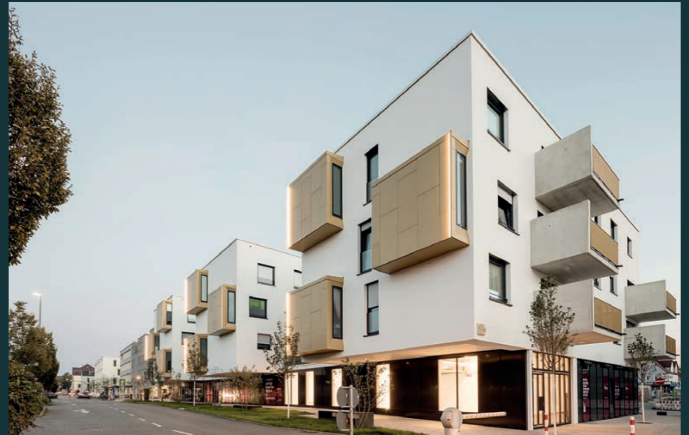
Kirchheim/Teck City Cube, 2018