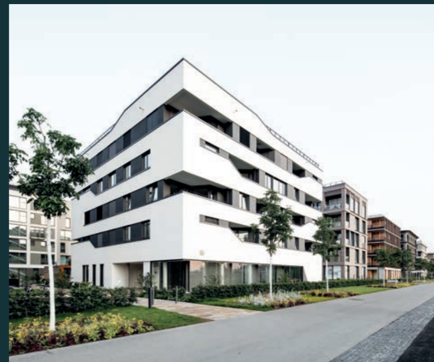
Heilbronn Urban Garden, 2018