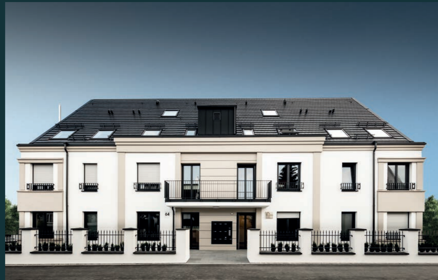
Ludwigsburg Barockoko, 2017