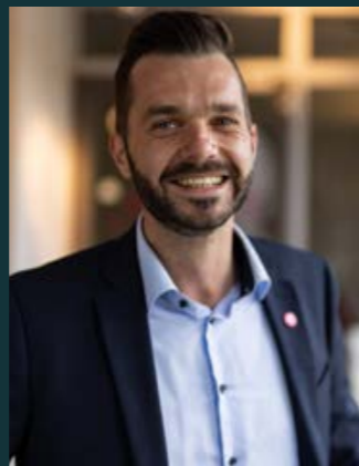
Philipp Model Verkauf Baustolz