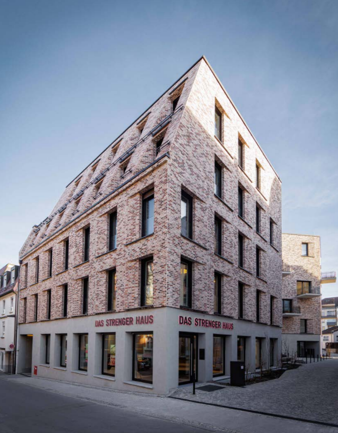
Ludwigsburg Das Strenger Haus, 2021