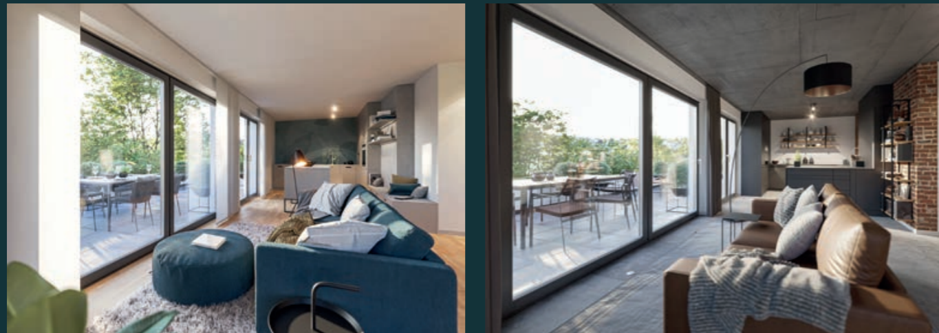
Urban (oben links) Loft (oben rechts) Natur (unten)

Mit unseren Interieurlinien Urban, Natur und Loft bieten wir Ihnen drei stilvolle Designs, mit denen Sie Ihrer Wohnung eine ganz persönliche Note verleihen. Die Boden-, Wand-, und Balkonbeläge sowie Türen, Decken und das Lichtkonzept sind von unserer Innenarchitektin perfekt aufeinander abgestimmt. So erwartet Sie beim Einzug ein perfekt designtes Zuhause.