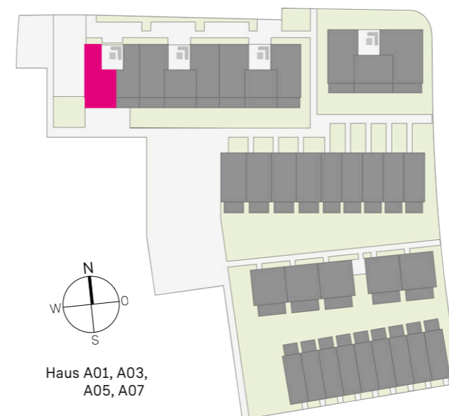
Haus A01, A03, A05, A07