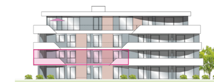
1.OG Ansicht Süd