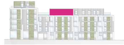
Haus B - Ansicht Ost