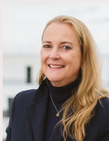
Nikola Schöneich Verkauf

7 Tage die Woche: Jetzt Beratung buchen.