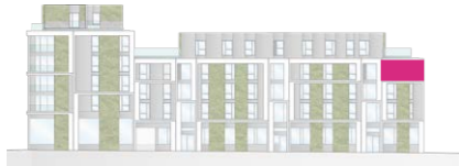
Haus B - Ansicht Ost