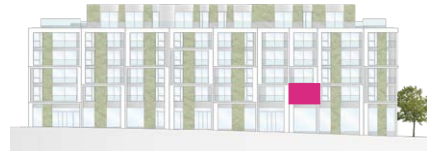
Haus A - Ansicht Süd