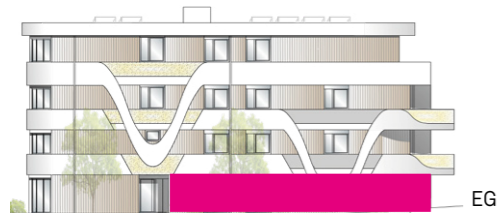
Haus E - Ansicht Nord