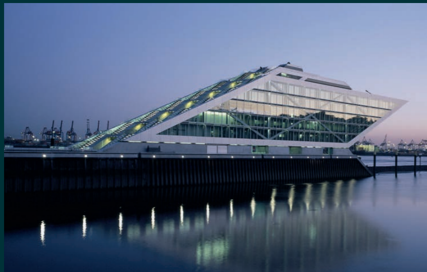
Dockland Bürogebäude Hamburg, 2006