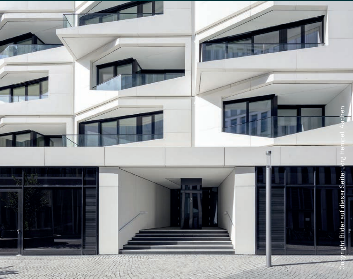
Flare of Frankfurt Hotel, Wohn- und Geschäftshaus Frankfurt Am Main, 2019