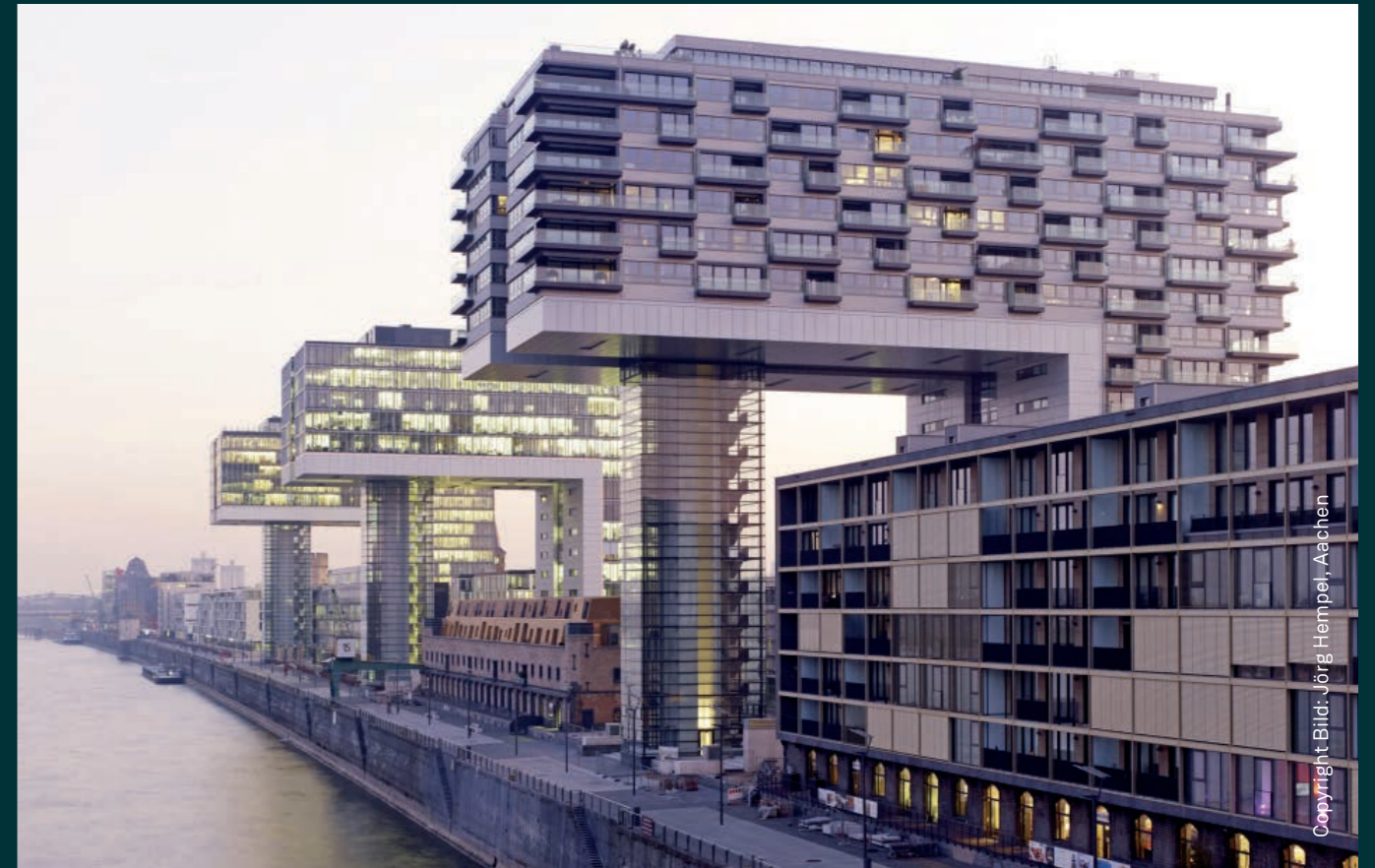
Kranhäuser Büro- und Wohngebäude Köln, 2010