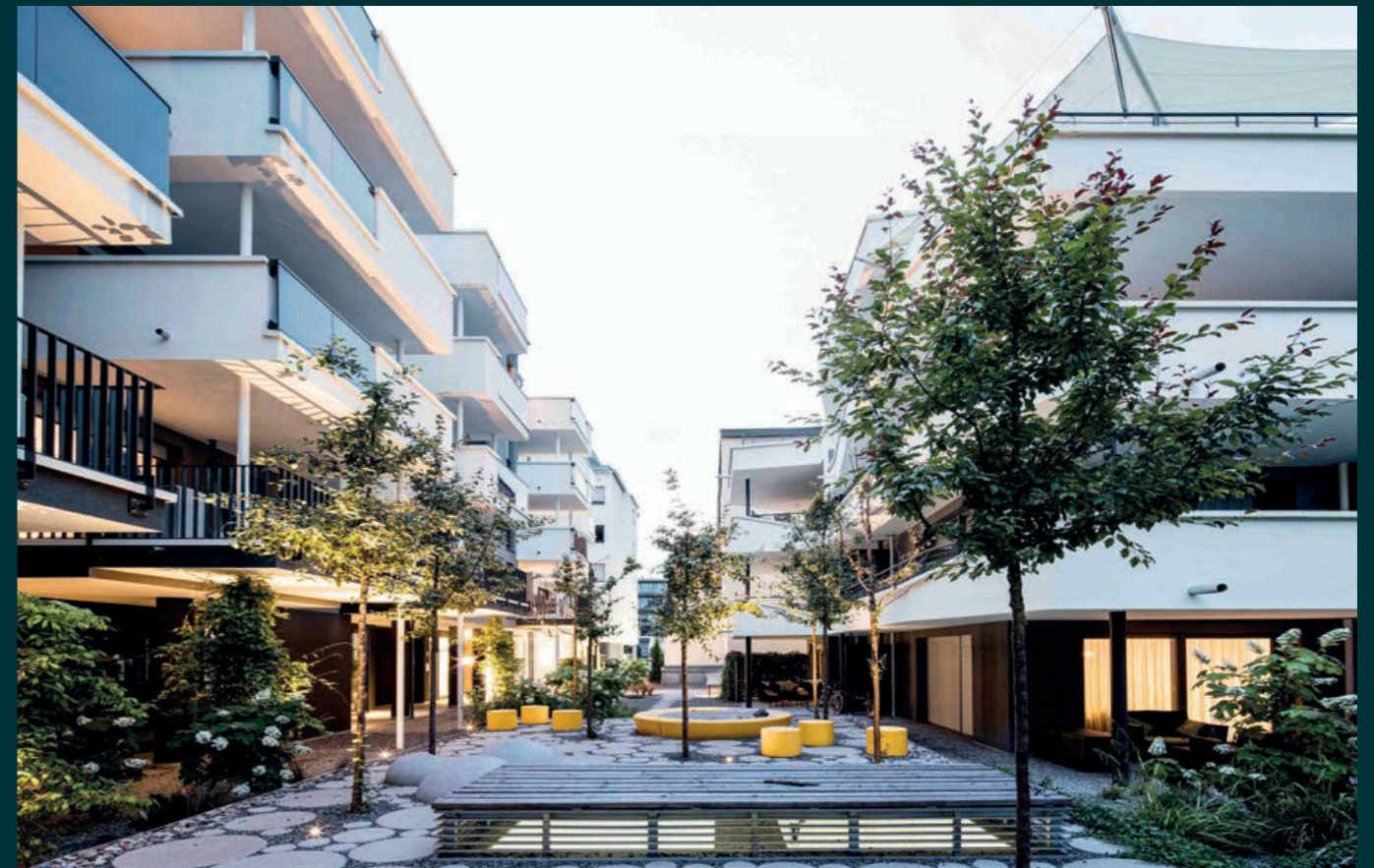
Stuttgart City-Puls, 2016