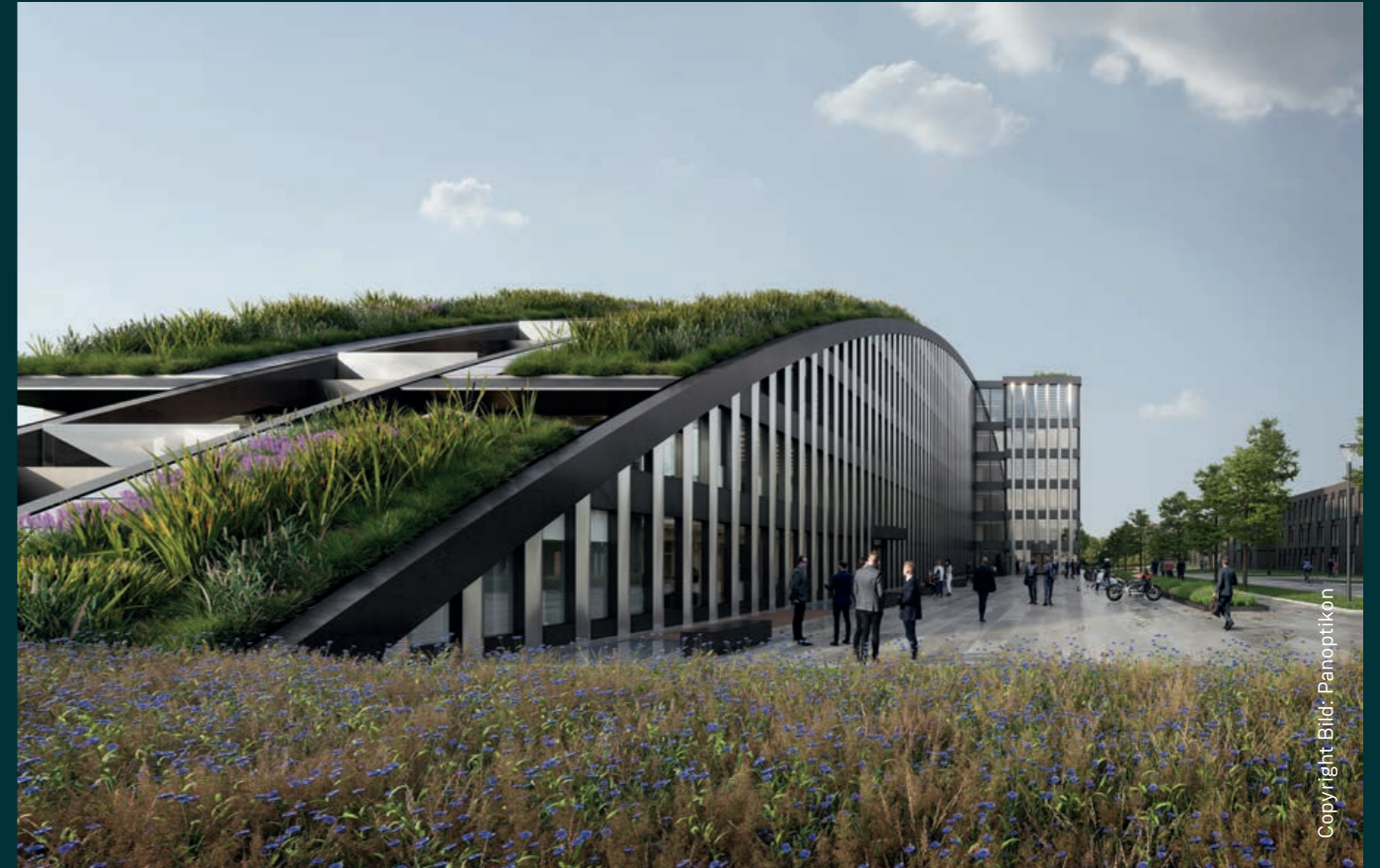
Innovationsbogen Bürogebäude Augsburg, Planung 2020